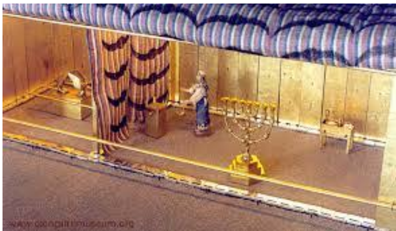
Le sacrificateur dans le lieu Saint

maison où sa gloire résidera, maison qui suivra le peuple dans sa marche jusqu'à Jérusalem .