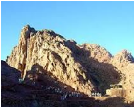
Le Exode d'Israël d'Égypte et entrée en Canaan

Moïse reçut l'Alliance, construisit le tabernacle, et donna les lévites à Aaron pour le service du Tabernacle. Le tabernacle fut dressé, soit dans la péninsule du Sinaï (comme on l'a toujours cru), soit selon une interprétation « moderne » en Arabie comme le dit Paul aux Galates, dans une phrase où il parle allégoriquement, c'est-à-dire de comparaisons à ne pas prendre au sens littéral :